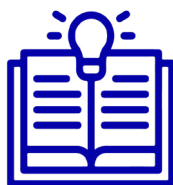
Figura 1. Temas abordados en este material de lectura.

Cápsula informativa sobre el Sistema GUATECOMPRAS