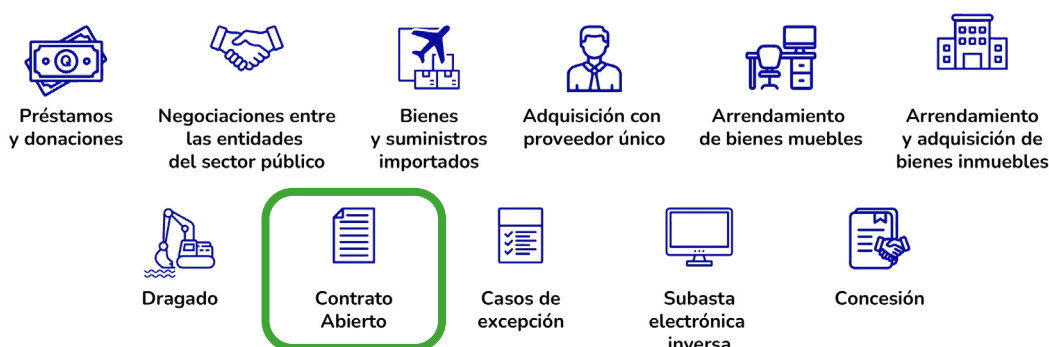
Figura 1. Íconos ilustrativos de las modalidades de adquisición pública: Contrato Abierto.

Nota. Elaboración propia de la DIFODA, con íconos adaptados de Flaticon (s. f.).