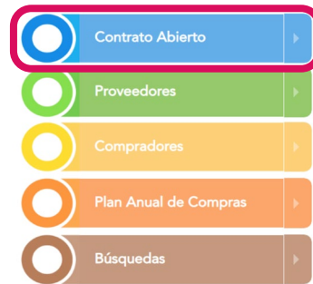
Figura 2. Principales módulos del Sistema GUATECOMPRAS.

Cabe resaltar que las adquisiciones públicas son un factor elemental para el cumplimiento de las metas y la ejecución de un Gobierno, además de impactar la economía al promover oportunidades de desarrollo para los proveedores. En otras palabras, el Sistema GUATECOMPRAS es un mercado electrónico en el que se encuentra la oferta y la demanda. Sus objetivos son la transparencia , la eficiencia y la promoción del desarrollo .